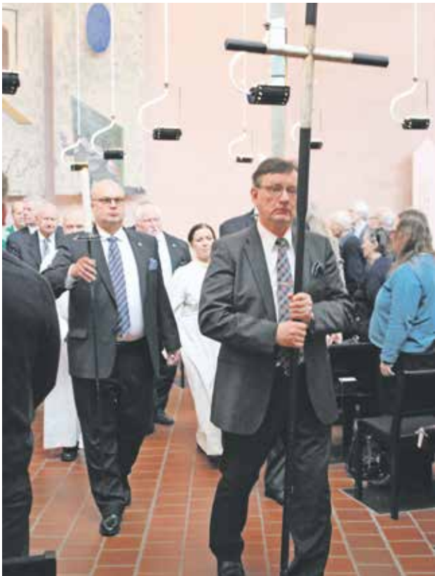
Leijonat avustajina kirkkokoppyhänä.