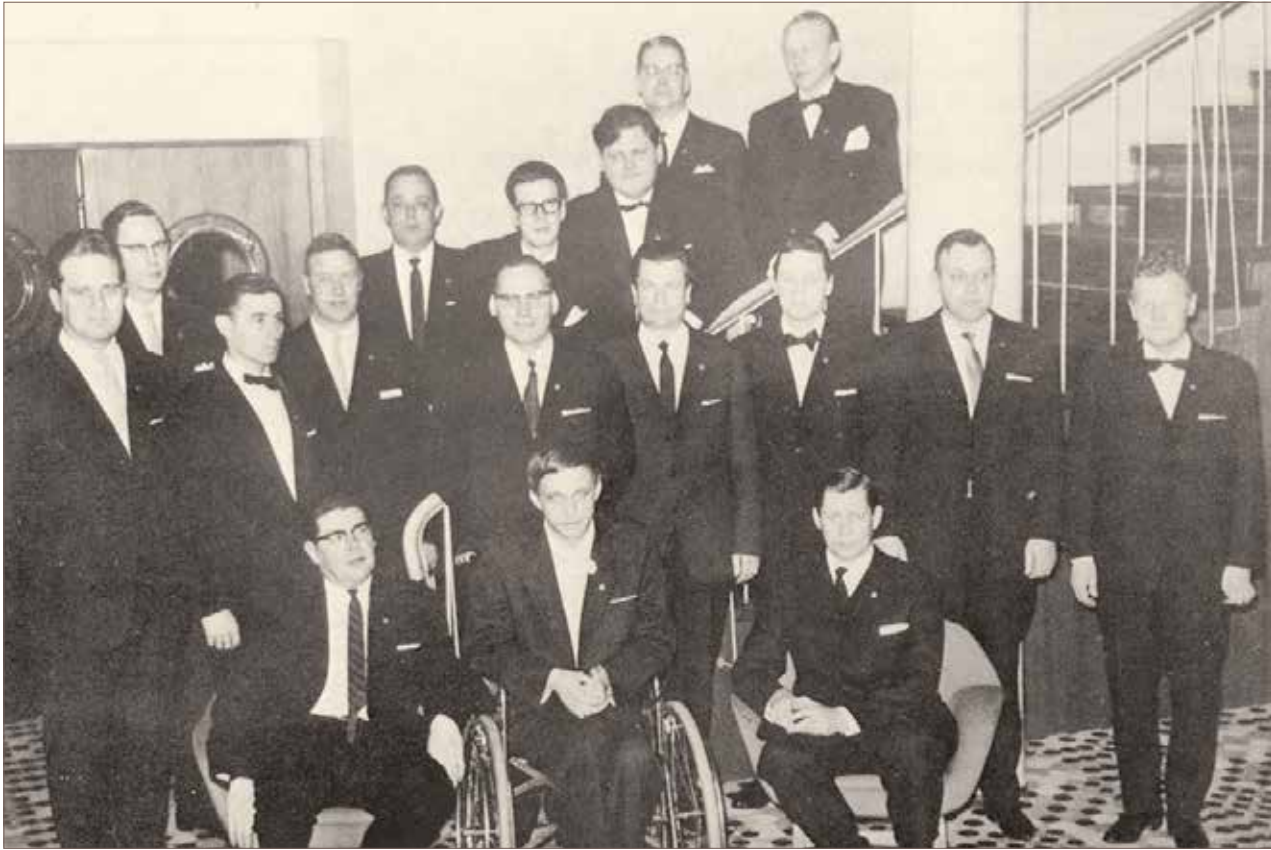
Perustamisjuhlan osallistujia ravintola White Ladyssa.