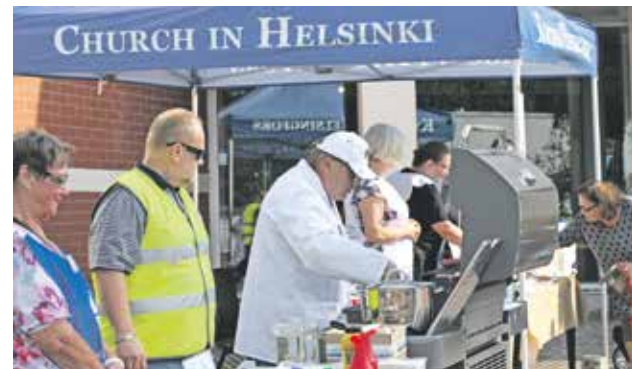
LC Helsinki Kontulan Leijonat makkarapaistossa.

Kun Mikaelinkirkko valmistui, se tarjosi juhlat