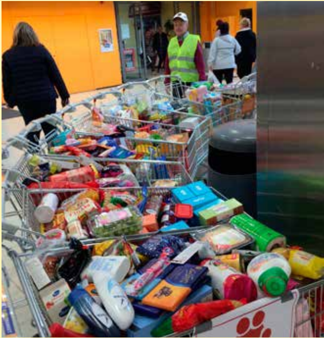
Auta Lasta - Auta Perhettä 2017 keräys tuotti yhteensä 11 ostoskärryllistä tavaraa!