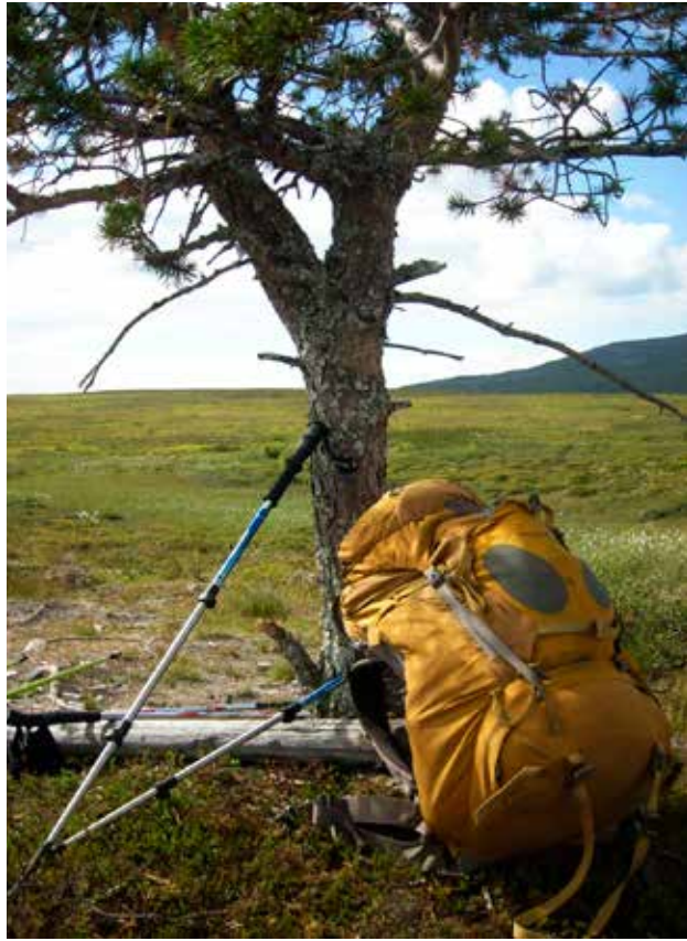
Kävelysauvat toimivat hyvin apuna vaelluksella.

Vaellus päivän aamuina lähdimme liikkeelle