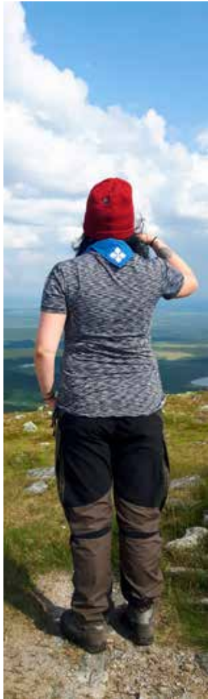
Ensimmäinen tunturin valloitus Hetta-Pallas vaellusreitiltä.

Lapin-vaellukselle lähti heinäkuussa 2017 kuusi innokasta vaeltajaa: viisi Kontutyttöä sekä yhden johtajan äiti. Huolellinen valmistautuminen oli tärkeää: ruokaa piti olla tarpeeksi koko vaelluksen ajaksi (myös herkkuja), mutta vaatteita ei saanut olla liikaa, sillä ne painavat rinkassa paljon. Yhteiset varusteet jaettiin vaeltajien kesken, jotta paino jakautuisi mahdollisimman tasapuolisesti. Osa vaeltajista myös lenkkeili ennen vaellusta, jotta jaksaisi kävellä