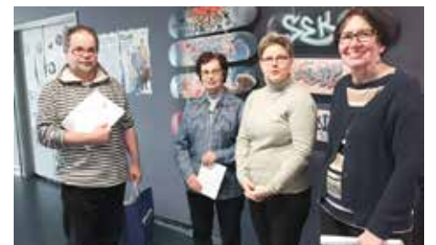
Stipendin luovutus Kontulan nuorisotalolla

Pian koittavassa Perheriehassa kannattaa tulla maistelemaan ladyjen leipomia makeita ja suolaisia suupaloja sekä herkullisia vohveleita kahvin, teen ja limun kanssa!