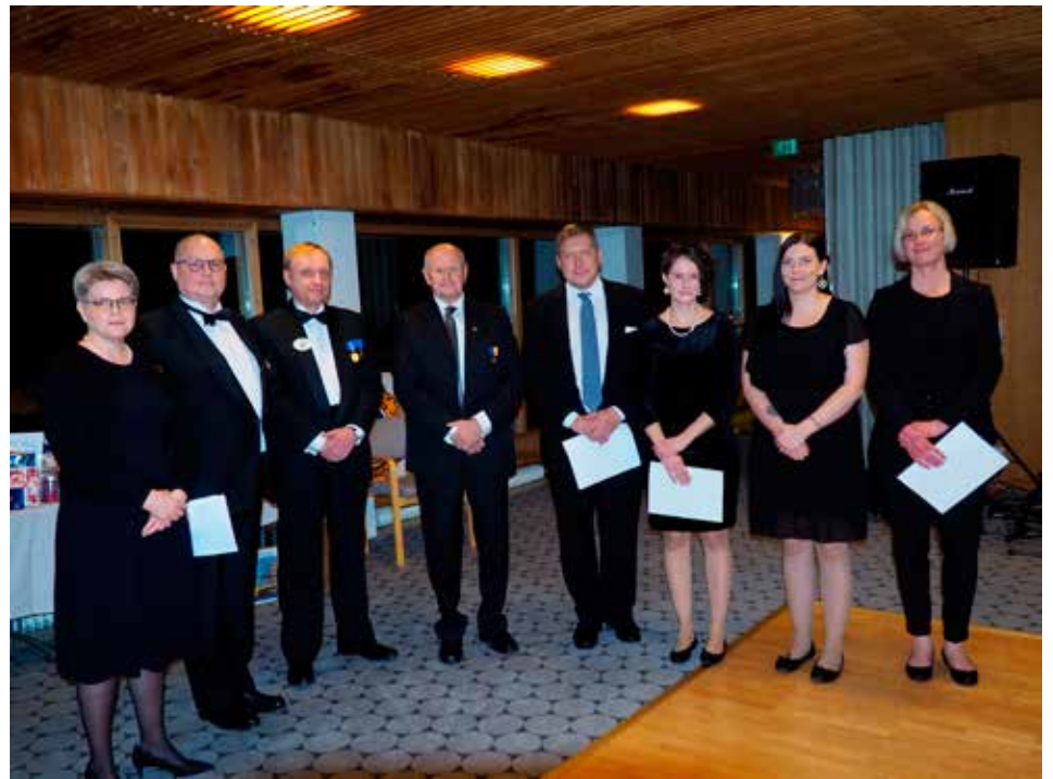
Stipendien jako 50-vuotisjuhlassa