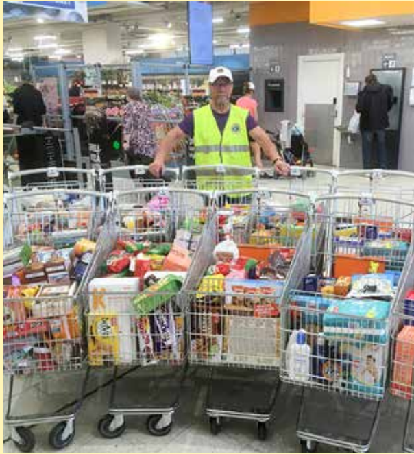
Auta Lasta – Auta Perhettä 2018 keräys tuotti taas hienosti tavaraa!