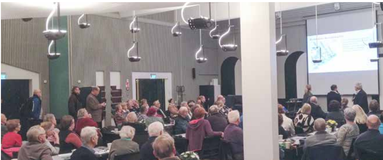
Vuimeksi kaupunkisuunnittelusta järjestettiin aluefoorumi Mikaelinkirkolla marraskuussa 2017.

Vetoa ja Voimaa Mellunkylään -verkoston toiminta on mm. parantanut asukkaiden ja järjestöjen mahdollisuuksia vaikuttaa kaupungin päätöksentekoon. Se on lisännyt eri tahojen aloitteellisuutta ja omatoimisuutta kaupunginosaa koskevissa kysymyksissä. Vapaaehtoistyöhön perustuva hanke on parantanut hyvällä ja aidolla tavalla asukkaiden, järjestöjen, luottamushenkilöiden ja kaupungin toimialojen vuorovaikutusta ja yhteistyötä. Myös tiedonkulku kaupunginhallinnosta Mellunkylään sekä alu-