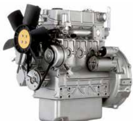
400-sarja 10-50 kW

Perkins tarjoaa laajan valikoiman eri päästöloukkien teollisuusmoottoreita, teholuokissa 10 kW - 225 kW. Uusimmat tekniset ratkaisut asennusvalmiina toimituksina.