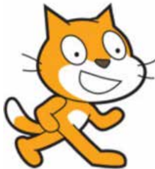
Scratch kuvat: Creative Commons Attribution-ShareAlike 4.0 International License (CC BY-SA 4.0)

Saat ensiksi tietää, mitä pelaajaoppiminen tarkoittaa ja