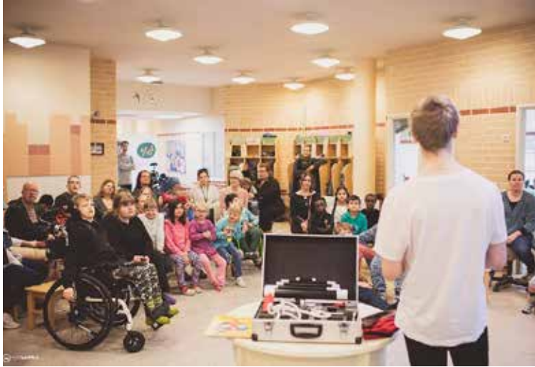
Liikuta lasta -tiedotustilaisuus.

Toimintamme kantavana ajatuksena on mennä oppitunneille ja tuoda oppilaat eri alojen ja liikuntamuotojen pariin. Juuri tämä erottaa toimintamme oleellisesti muusta lasten ja nuorten hyvinvointiin tä-