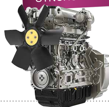
904-sarja 50-100 kW