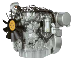
854-sarja 45-86 kW