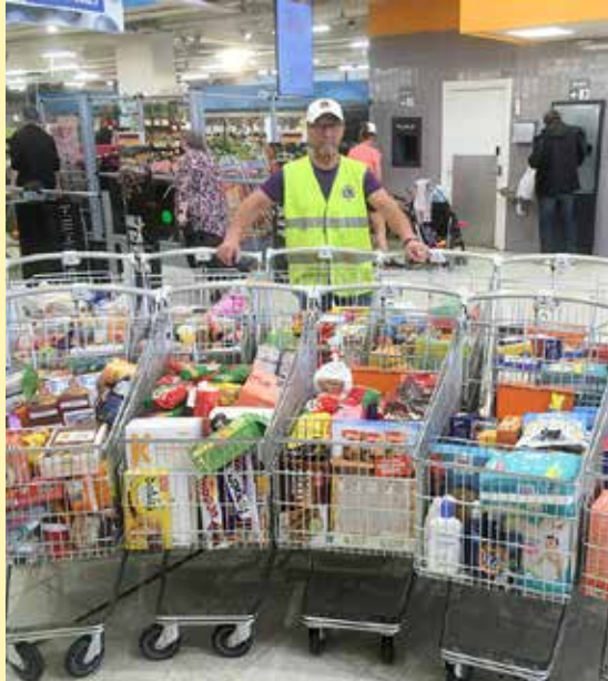
Auta Lasta – Auta Perhettä 2019 keräys tuotti taas hienosti tavaraa!