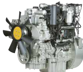
1200-sarja 60-225 kW