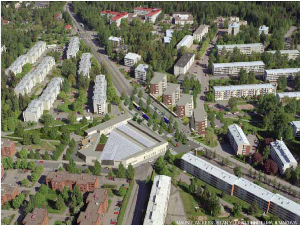
Maunulan keskustan yleissuunnitelma, viistoilmakuva. © Ark-House arkitehdit Oy ja kaupunginmittausosasto 2003.