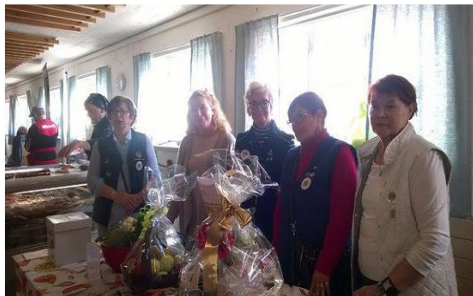
POHJANRANNAN MYYJÄISTEN HUIPPUPORUKKAA 2016:) ja upeat arpavotot!