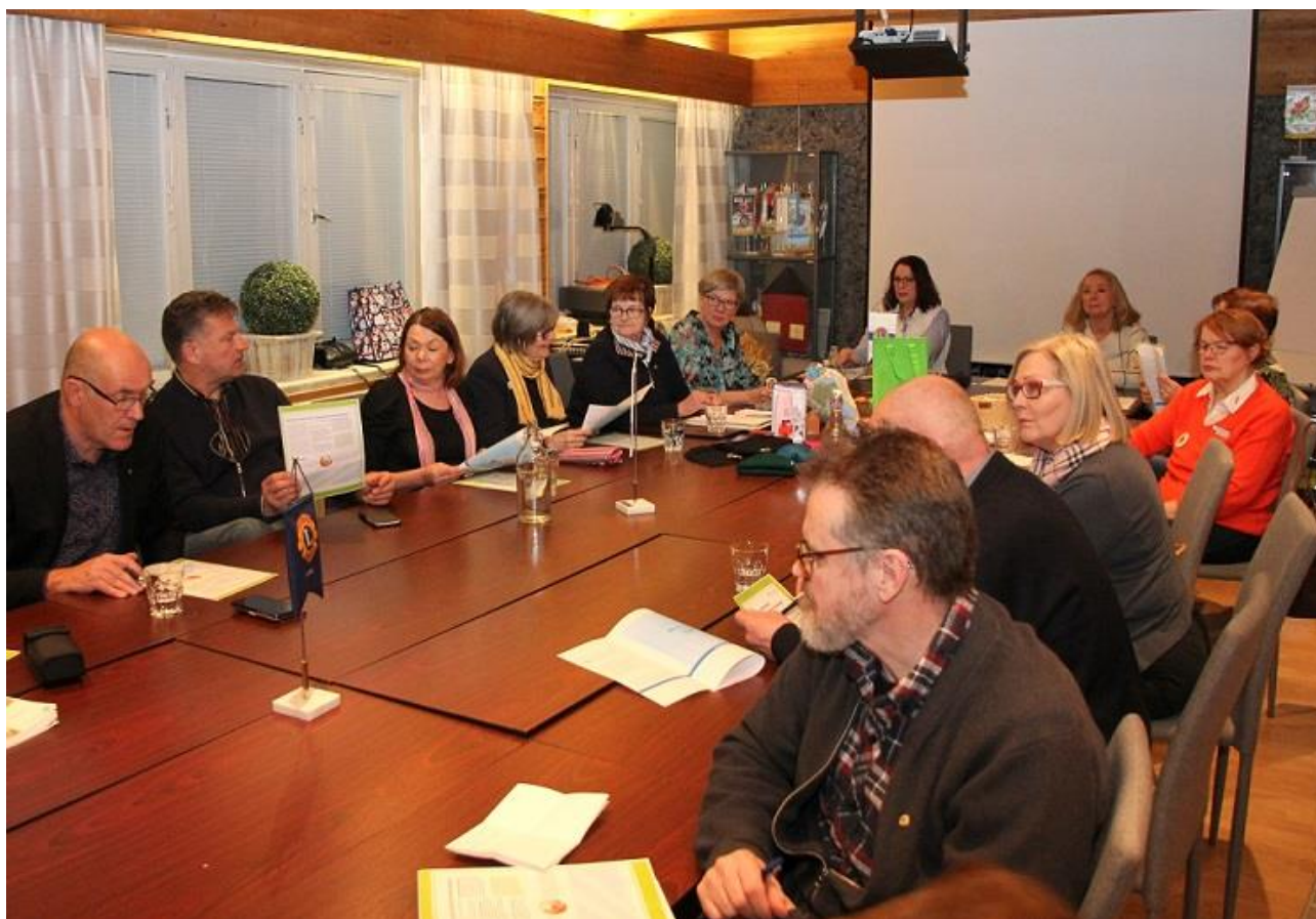
Diabetes-ilta järjestettiin 13.3.2019 yhdessä LC Kemin kanssa.