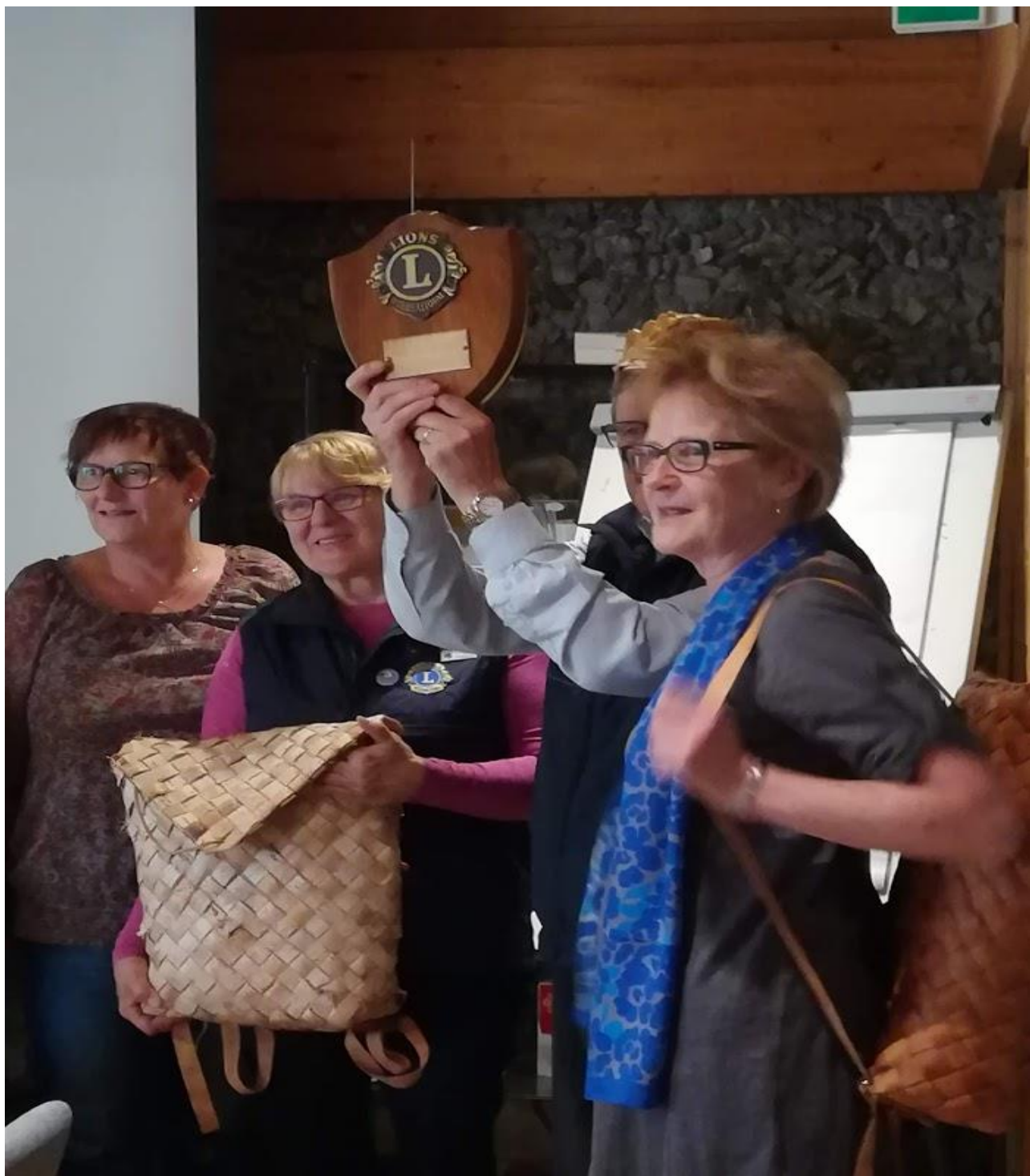
Kilvenryöstö 12.09.2018 kokouksessa Merihovissa. Kilven ryöstäjä LC Posio. Myös LC Kemi sekä LC Keminmaa/Neidonkengät tulivat ryöstöretkelle.