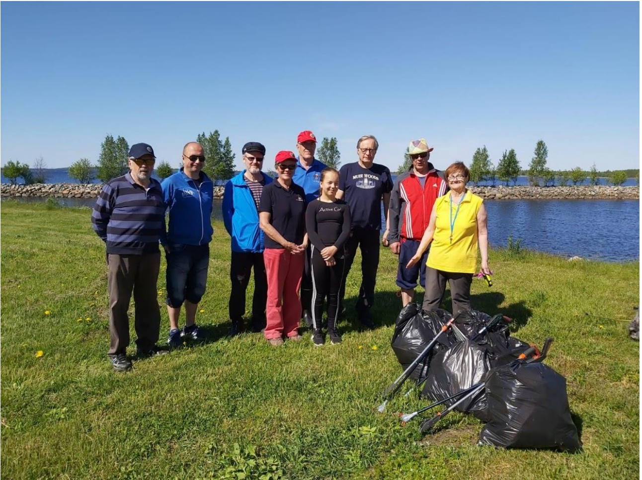
Lions-liiton Puhtaat vedet-aktiviteetti toteutettiin yhdessä LC Kemin kanssa 15.6.2019 puhdistamalla Kemin ranta-alueella Kiikelin ja Mansikkakanokan väliltä.