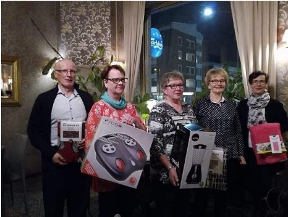
Kuvassa vauva-arvauskilpailun 2019 voittajat. Palkintokahvit juotiin Hotelli Merihovissa 15.1.2019.