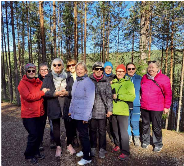
Lions Hämeenkyrön Kyröttäret lokakuussa 2023 Kuusamossa.