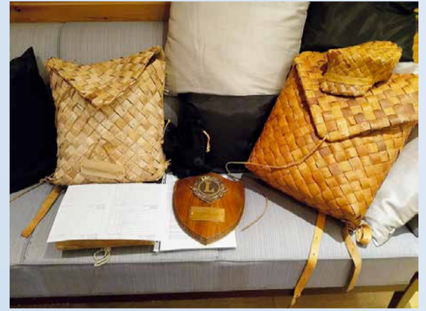
Ritarin kilpi ja tarvikkeet.