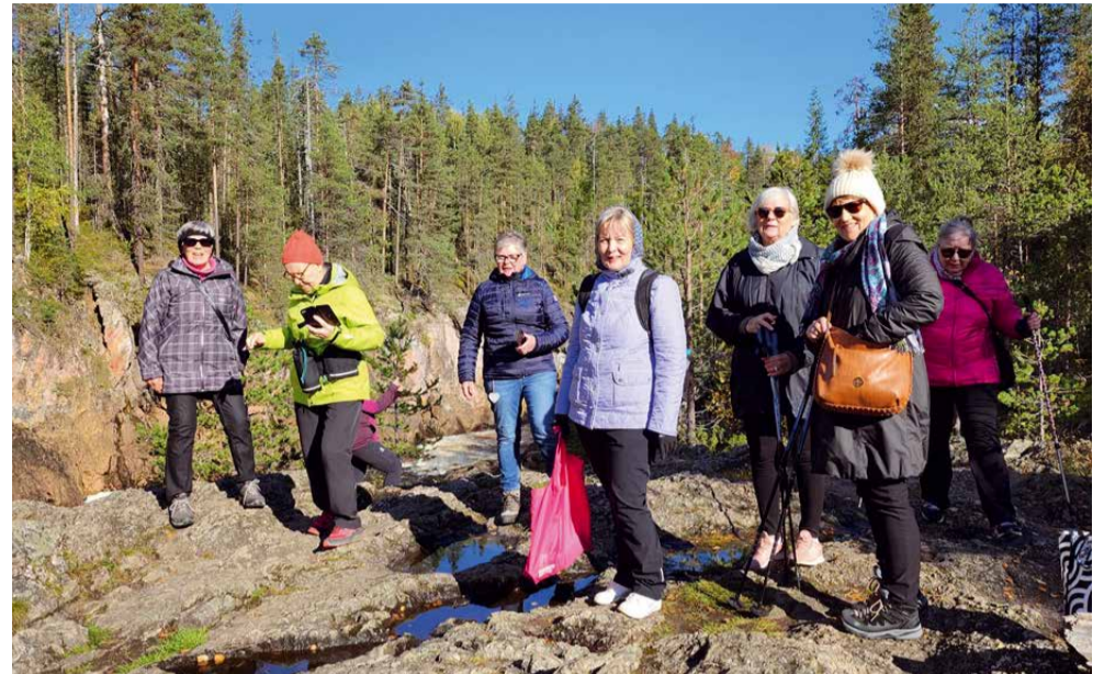
Lions Vantaa Vernissat syyskuussa 2023 Kuusamossa.

Kuusamossa olemme vienneet ystävyysklubiemme vieraita upeisiin luontokohteisiin, istuttu nuotion äärellä, ihasteltu revontulia ja juttu on luistanut. Yhteiset ravintolaillalliset ovat tuoneet