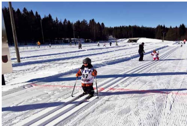
Leijona-hiihdot maaliintulo. Kallinkankaan hiihtokeskus tarjosi parastaan puhumattakaan lapsista, jotka nauttivat hiihdosta ja maaliintulosta.