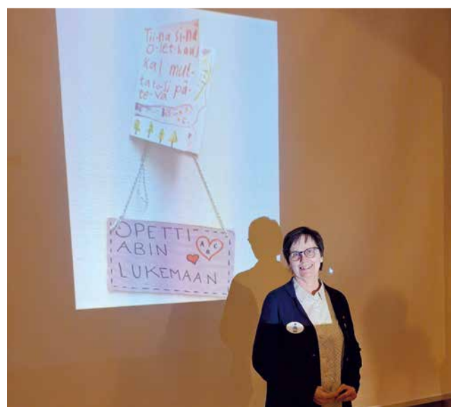
Tiinan vierailu Posiolla 6.2.2024.