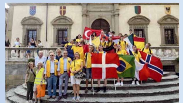
Kesällä 2023 Italiassa kansainvälisellä nuorisoleirillä olevat nuoret vierailivat Roomassa, Toscanassa ja Firenzessä.