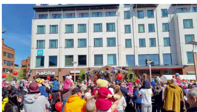
Klubimme leijonia oli järjestyksenvalvojina myös kesäkuussa Kulma-karnevaalissa Rovaniemellä.