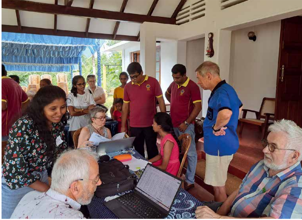
Kummilasten tarkastus ja haastattelu.

Suomen Sri Lankan suur-lähettiläs Suikkanen totesi marraskuussa 2017 sairaalan alakerran avajaispuheessa, että UM ei ole koskaan