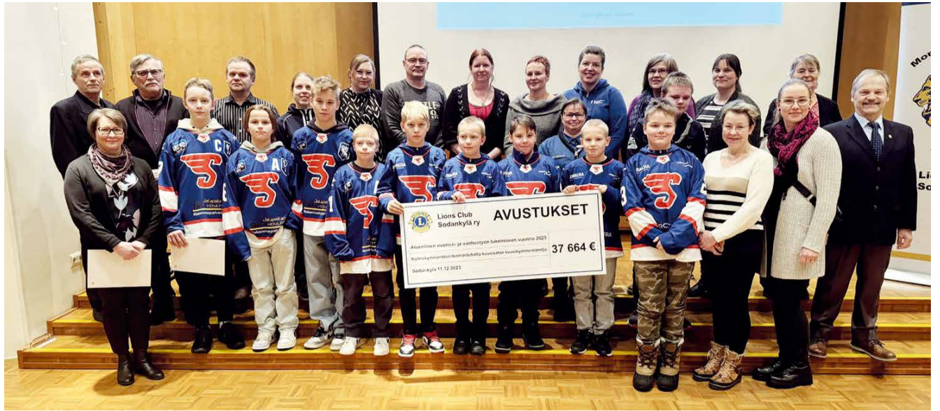
Vuoden 2023 Martin Pilkin tuotosta jaettiin tukea mm. nuoriso- ja urheiluseuroille sekä alueelliselle vanhustyölle.