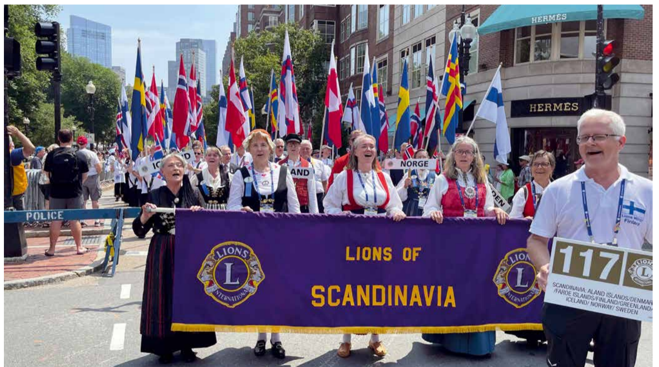
Pohjoismaiden lionit marssissa.

jelmiä. Toisaalta tämän päättökseen tulee lopultaan teemmään Turun vuosikokous.