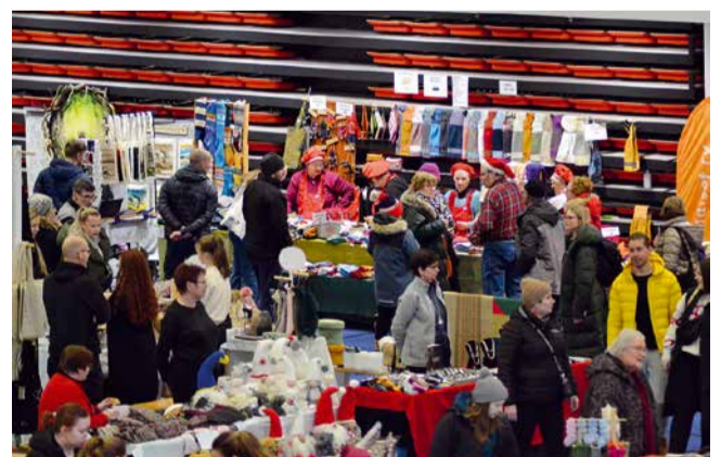
Joulumyyjäisten kävijämäärä ylsi jälleen n. 3500 henkilöön.

mukana ja tapahtuma onnistui todella hyvin. Tapahtuman tuotto lahjoitettiin Rovaniemen Mieli ry:n nuorten mielenterveystyön hyväksi. Monenlaista tapahtumaa on siis klubillamme vuoden aikana ollut ja monenlaista