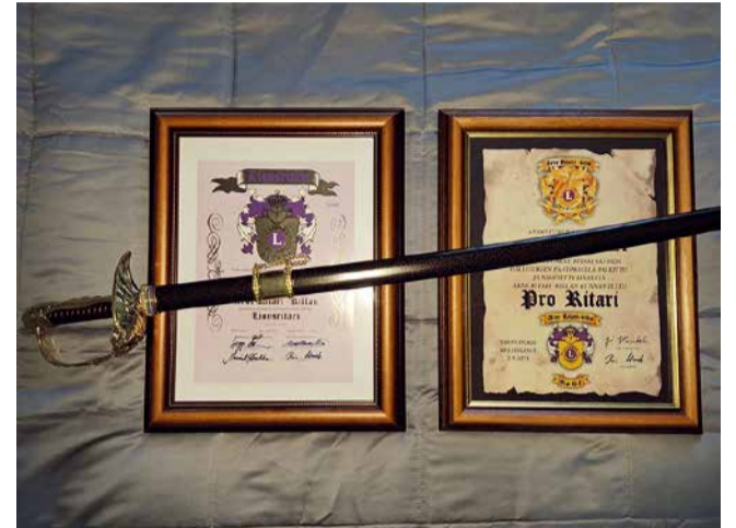
Kuvituskuvassa Ritari ja Pro Ritari -taulut ja Pro Ritareille luovutettava miekka.

Ymmärrämme, että maailmalla tarvitaan nyt paljon apuamme, etenkin Ukrainassa ja myös saapuneille