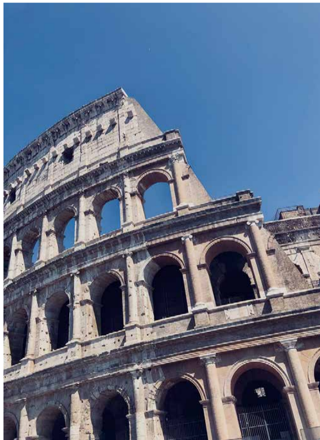
Roomassa oli paljon historiallisia paikkoja nähtävänä.