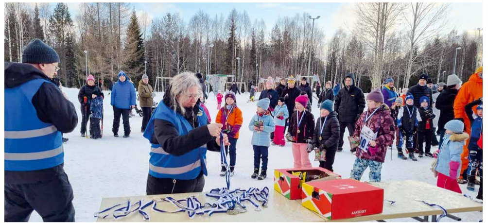
Hiihtourakan jälkeen kaikki nappulahiihtoihin osallistuneet saivat kuumaa mehua lämmikkeeksi ennen palkintojenjakoa. Kaikille osallistujille jaettiin mitalit ja karkkipussit.