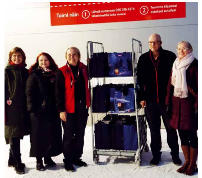
Keminmaan Citymarketin kauppiat, perhetyöntekijä yhdessä klubimme jäsenten kanssa.