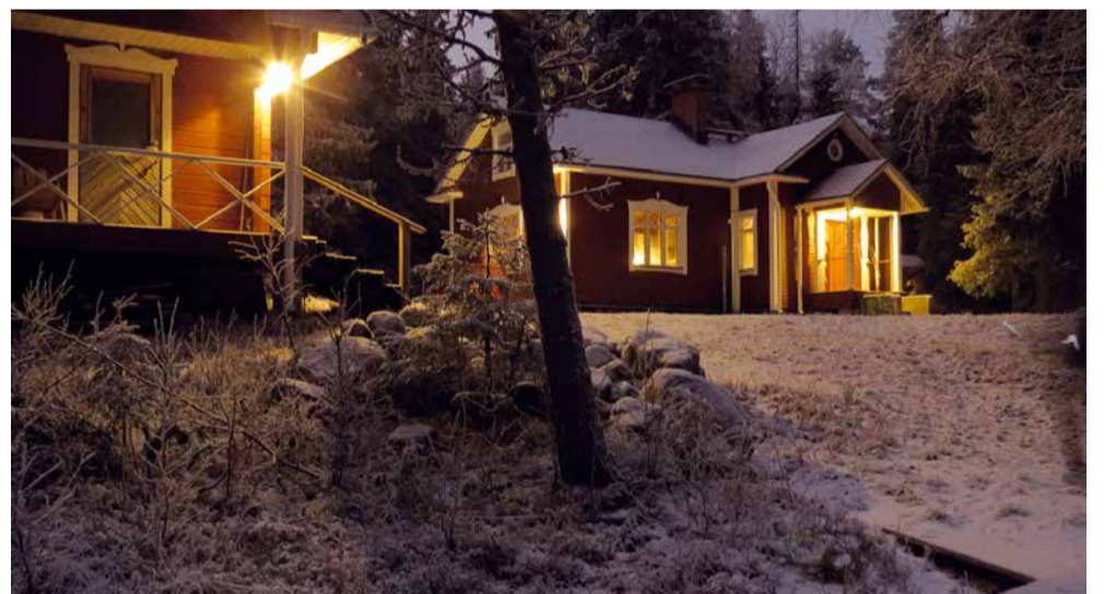
Partiolaiset esittivät vuonna 2021 toiveen Oijusluoman Eräkämpän sähköistyksestä. Valot helpottaisivat kämpän käyttöä pimeinä vuodenaikoina ja pihamaan valaistus toisi turvallisuuttakin.