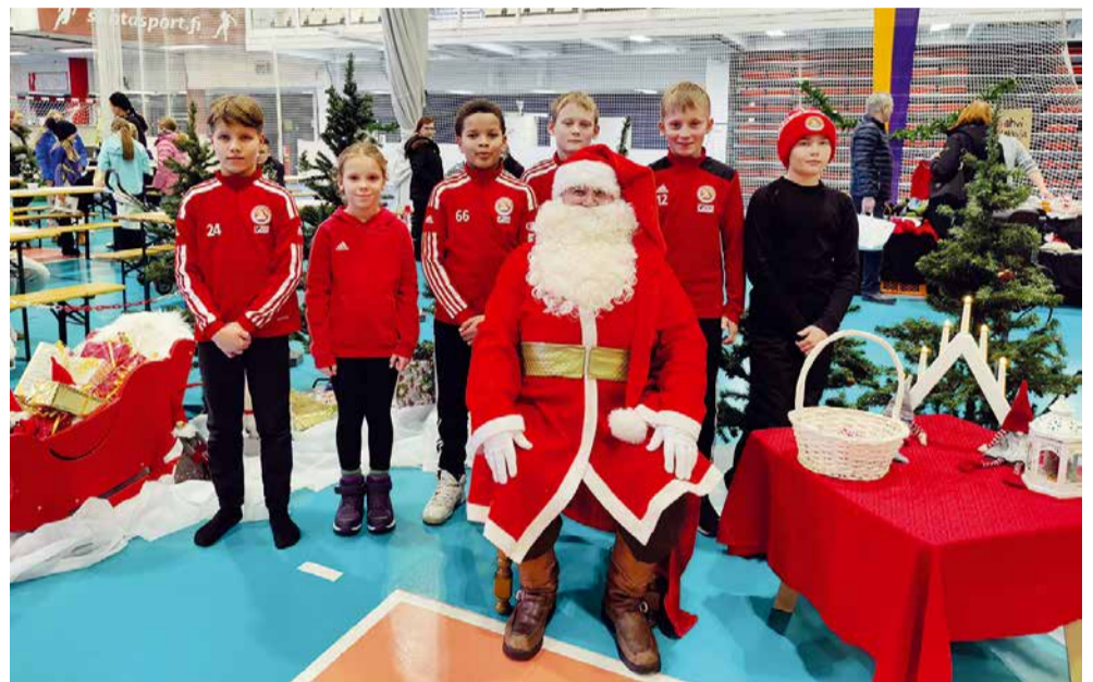
Joulupukki haastatteli myös FC Santa Clausin Junioreiden Pukinpoikien jalkapallo- nuoria heidän tulevasta Irlannin ystävyysottelureissustaan, jonka toteuttamisessa on myös klubimme osaltaan mukana.