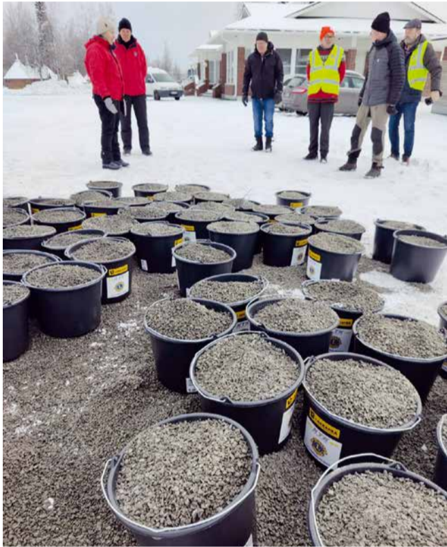
Lions Club Tornio Putaan hiekoitussepeä aktiviteetti toteutettiin toisen kerran.