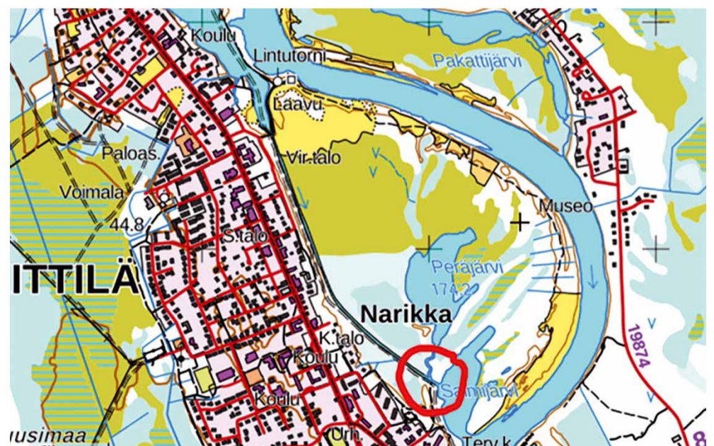
Sillan paikka punaisessa ympyrässä, josta oikealle tulee polku raivattavaksi.