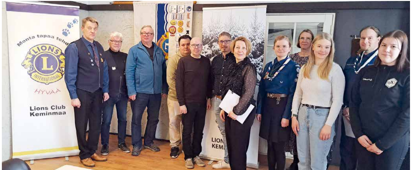
Isohaaran tulvaveikkauksen lienee vanhin yhtäjaksoinen rahankeruuprojekti Suomen Lions-liikkeessä. LC Keminmaa jakaa koko lyhentämättömän tuoton keväisin keminmaalaisille kouluille, urheiluseuroille ja nuorisjärjestöille. Kuvassa kevään 2023 stipendien vastaanottajia.

Valtakunnallisen Leijonahiihtotapahtuman tavoitteena on innostaa lapset suksille. Pienten lasten kannalta tapahtuma onnistuu. Toivottavasti Leijonahiihtoja voidaan jatkaa myös nuor-