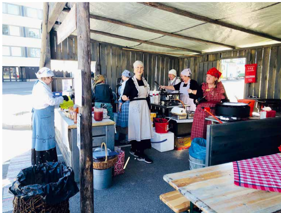
Iloisesta lättyjen myyntiporukasta on tullut myönteistä palautetta.

Viime kesän 2023 lättypuodin tuotoilla olemme voineet tukea mm. Rovaniemen Erityislasten omaisten ELO ry:n, Lapin keskussairaalan nuorten ja lasten psykiatriaosaston, Lapin CP-yhdistyksen, Rovaniemen kaupungin Etsivän nuorisotyön toimintaa sekä Mannerheimin Lastensuojeluliiton koululaisten loma-