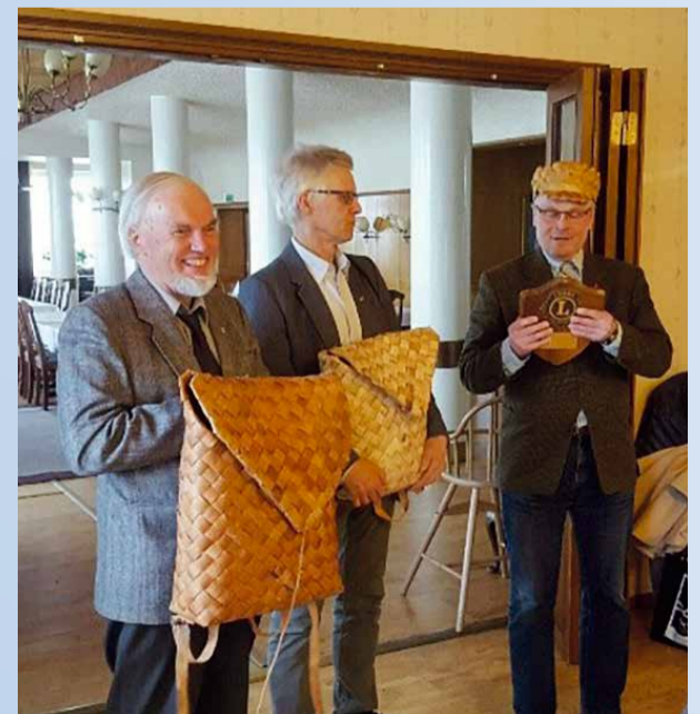
Ritari Kilven ryöstöretket toisiin klubeihin ovat hauskoja ja puhuttavat vielä vuosien jälkeen.