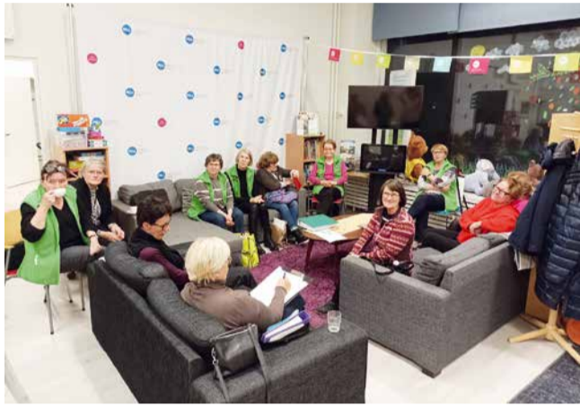
LC Rovaniemi/Petronellan klubi-ilta MLL tiloissa.